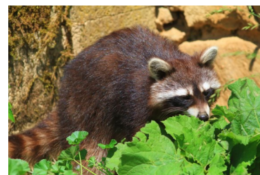
Article et photographie par Jean-François Noblet

Ce raton laveur rejoint la liste des espèces observées à La Buisse dans le cadre de l'Atlas de la Biodiversité Communale engagé par la commune en partenariat avec l'association Le Pic Vert (infos : abc-labuisse.fr ).